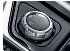
Perilla para cambio de transmisión