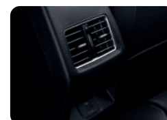
Salida AC y conexión USB