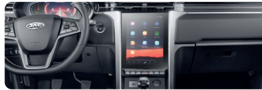
Pantalla vertical de 10,4"