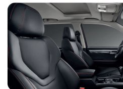
Ergonomía y Confort