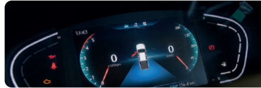
Tablero de instrumentos de 7" LED