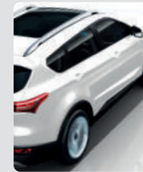
ASISTENTE EN PENDIENTE (HAC)