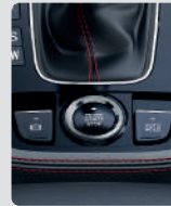
BOTÓN ENCENDIDÓ / AUTOHOLD / PARKING