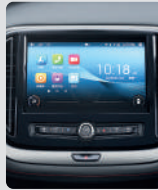
PANTALLA MULTIMEDIA 10"