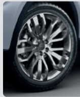
NEUMÁTICOS RIN 20