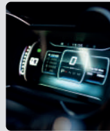
PANEL DIGITAL DE INSTRUMENTOS 12.3"