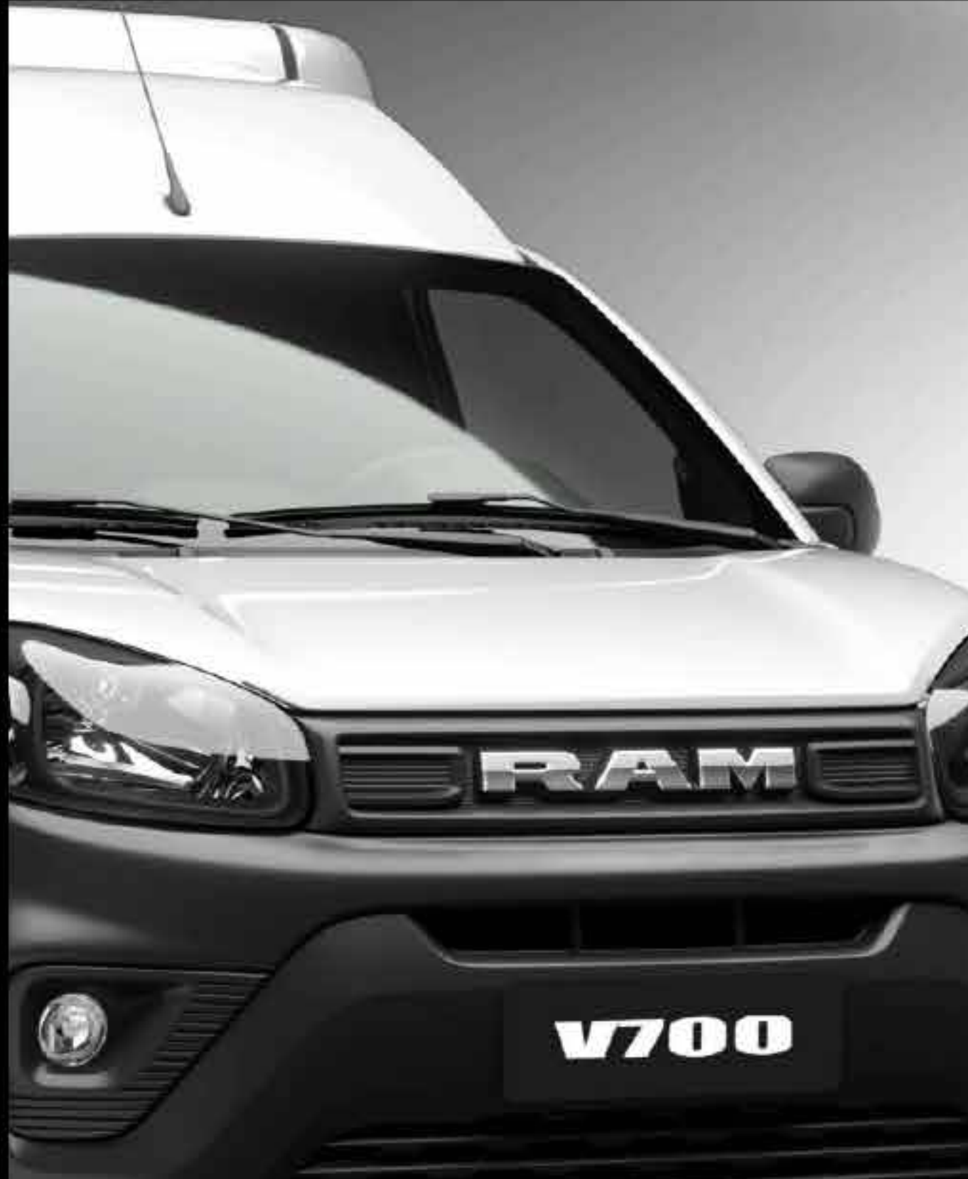
NUEVO DISEÑO EXTERIOR