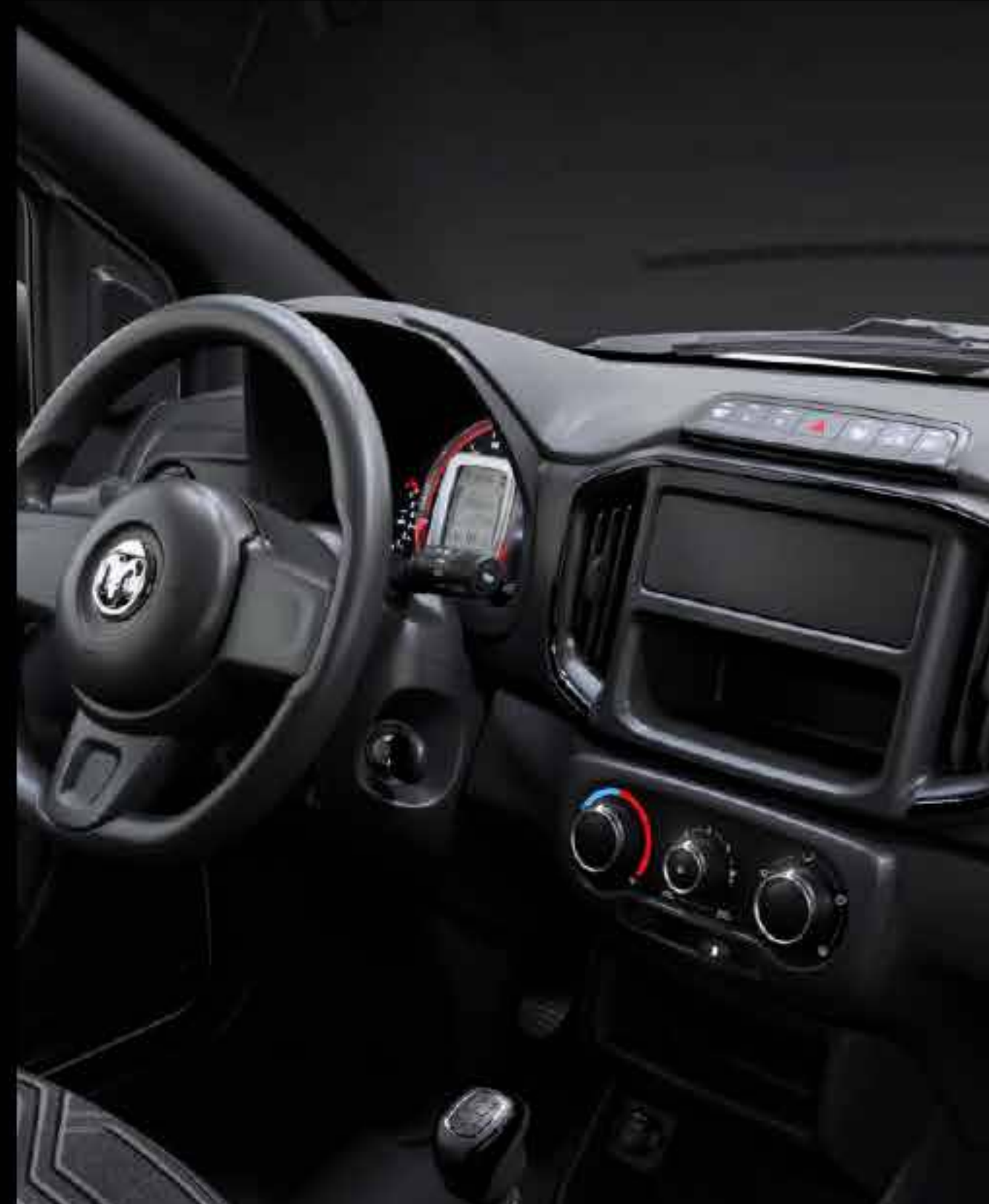
NUEVO INTERIOR FUNCIONAL