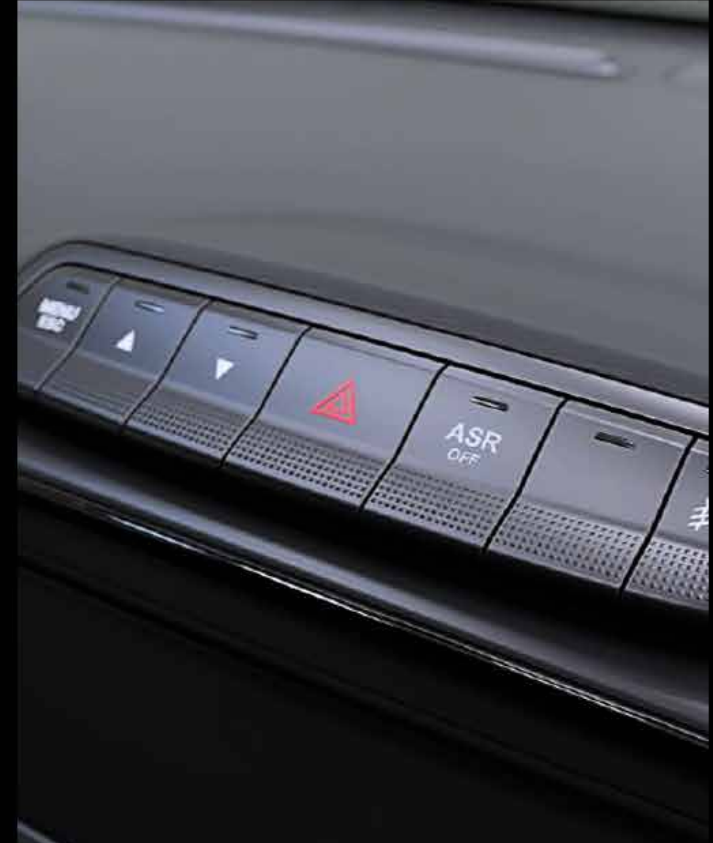
INTERIOR SEGURO Y ECONÓMICO