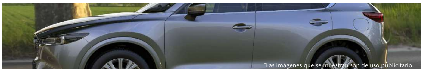
*Las imágenes que se muestran son de uso publicitario.